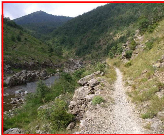
Il sentiero costeggia il torrente

Il Servizio Parchi individua i sentieri più significativi degli 8 settori al fine di promuovere forme di turismo a basso impatto ambientale e una migliore conoscenza del nostro territorio.