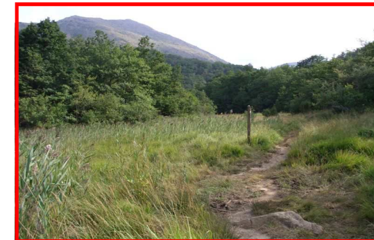
Piccola radura sul sentiero