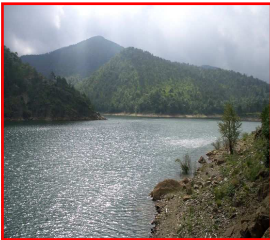
Il lago Bruno

Autostrade A26 Genova—Milano Uscita Serravalle Scrivia SP 165 fino al km 13,400 Parcheggio presso una delle piazzole della SP